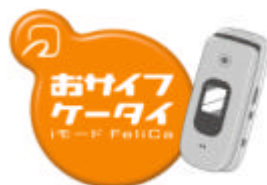
モバイルい~カード